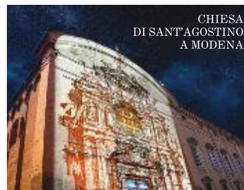
CHIESA DI SANT'AGOSTINO A MODENA

CON "SOGNO O SON DESTE" IL RESTAURO DEL PATRIMONIO CULTURALE ESTENSE È MULTIMEDIALE