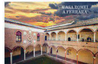
CASA ROMEI A FERRARA